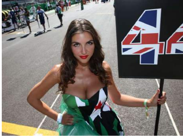
ECCE PUELLA *NUMERIFERA ( grid-girl )

Hae iuvencae, quae vesticulis angustis vestitae in curriculi initio steterunt titulosque numeris autoraedariorumque nominibus instructos sublatis tenuerunt, nunc non iam adhibentur ad curricula facienda; neque iam adhibentur puellae sagittulariae 1 vesticulis breviculis indutae, quae sagittulatores usque ad scaenam comitatae certaminibus quendam splendorem attribuebant muliebrem. Nuper quadam in Britanniae emissione televisificâ duae puellae sagittulariae amarissimê lamentatae sunt, quod nunc operulam suam, quam semper fecissent magno cum gaudio, essent perditurae. Quae puellae pulchrae non potuerunt, quin audirent quandam feministriam se vituperantem, quod mulieribus puellisque exemplum dedissent malum.