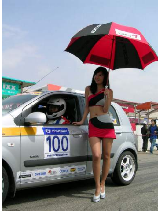
ECCE PUELLAE UMBELLIFERAE ( grid-girls, umbrella girls )

At spiritus temporis socialis non solum adversatur bellis artibus, sermoni bellarum litterarum personisve cinematum ficticiis, sed saepius saepiusque etiam mulieribus vitae realis. Exempli gratiâ nuper decretum est, ne in formulae primae curriculis autocineticis puellae umbelliferae sive numeriferae ( grid-girls ) pergerent fungi munere suo.