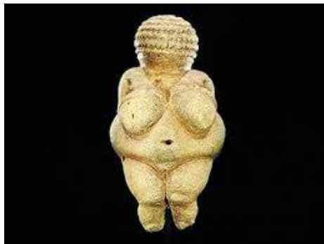
ECCE VENUS WILLENDORPIENSIS OBIECTUM LUBIDINIS VIRORUM NEOLITHICUM

Adhuc sunt, qui putent tantummodo fluctum fieri in simpulo, qui mox sedetur. Furorem, quo hodie in provinciâ artium animadvertatur in sexismum verum vel putativum, non diutius perduraturum esse, sed feministrias mox aliquando ad sanitatem reversuras esse. Quidnam fieret de museis? Feministriae si summâ cum severitate recenserent artificia illis insita omnemque mammam mulieris intectam censurâ notarent, oeci museorum mox essent evacuati. Necnon necesse esset feministrias purgatrices morales recedere in tempora diu, immo diutissimê transacta, usque ad Venerem Willendorpiensem ubique terrarum illustrissimam, quae propter formas sui corporis uberrimas non solum habetur pro symbolo fertilitatis, sed etiam pro puellâ aetatis neolithicae affixoriâ 1 .