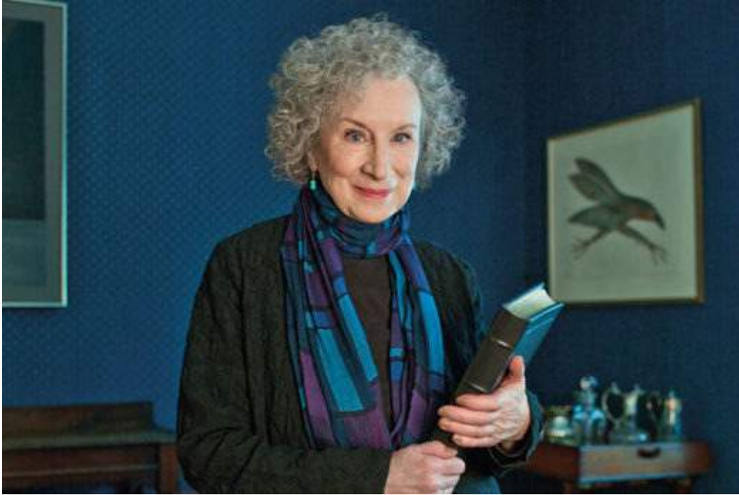
MARGARET ATWOOD (*a.1939)

Brevi post in Praemio Grammophoni attribuendo vesti affigendae erant rosae albae aut cameris obtendendae. Mulieres participantes, quae huic dictato non oboediverunt, habitae sunt proditrices rei bonae. At omnino non tolerantur mulieres, qui publicè recusant expeditionem #MeToo et audent ea dicere quae multae cogitant: hanc expeditionem feministrialem immoderatam factam esse vesanam instigationem virorum, mulieres non esse homines auxilii expertes, sed reverâ ipsae se defendere posse contra manûs ingratas genibus suis impositas.