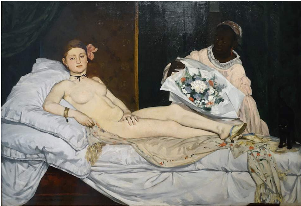
ECCE OLYMPIA. QUAM A.1863 PINXIT ÉDOUARD MANET.

cuiuscumque alius pictoris, qui fulmine sexismi pontificali 1 percutitur aut percutietur.