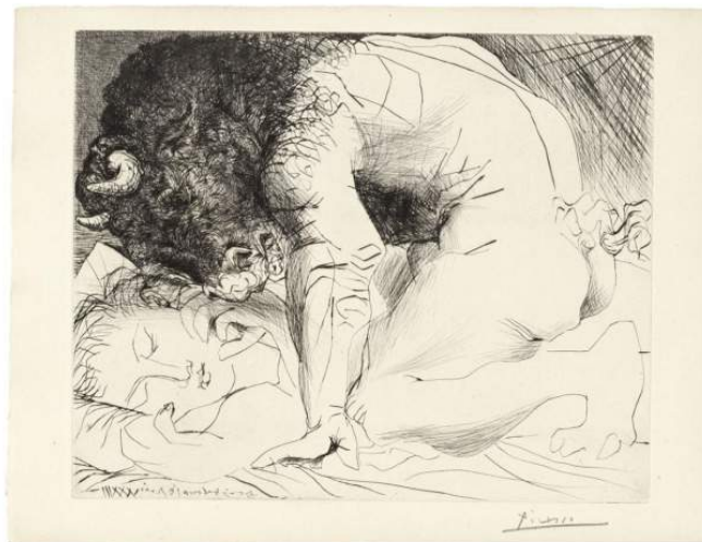
A. 1939 PINXIT PABLO PICASSO Minotaure caressant une Dormeuse