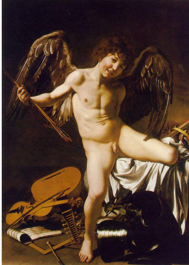
AMOR VICTORIOSUS A.1602 pinxit Caravaggio.