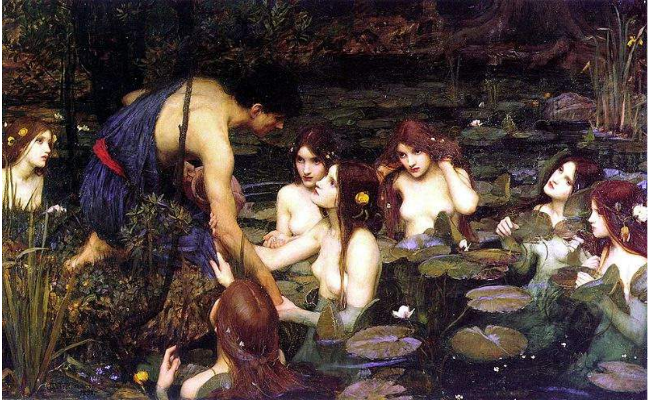
Hylas et nymphae. A.1896 pinxit John William Waterhouse .