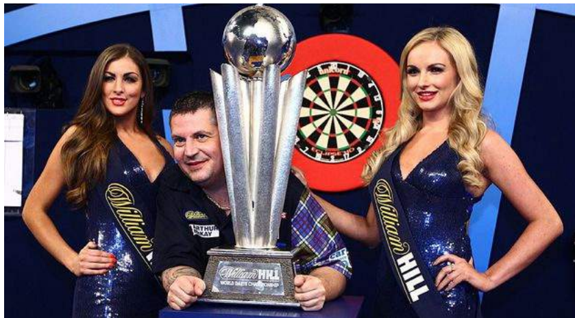
ECCE SAGITTULATOR CUI APPOSITAE SUNT DUAЕ PUELLAE SAGITTULARIAE

Hae iuvencae, quae vesticulis angustis vestitae in curriculi initio steterunt titulosque numeris autoraedariorumque nominibus instructos sublatis tenuerunt, nunc non iam adhibentur ad curricula facienda; neque iam adhibentur puellae sagittulariae 1 vesticulis breviculis indutae, quae sagittulatores usque ad scaenam comitatae certaminibus quendam splendorem attribuebant muliebrem. Nuper quadam in Britanniae emissione televisificâ duae puellae sagittulariae amarissimê lamentatae sunt, quod nunc operulam suam, quam semper fecissent magno cum gaudio, essent perditurae. Quae puellae pulchrae non potuerunt, quin audirent quandam feministriam se vituperantem, quod mulieribus puellisque exemplum dedissent malum.