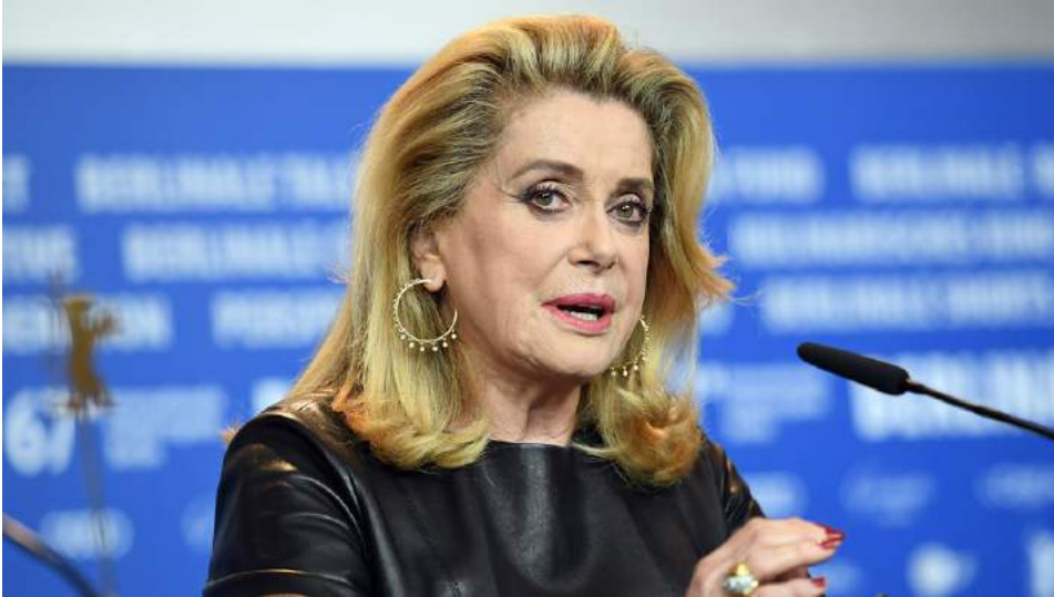
CATHERINE DENEUVE (*a.1943)